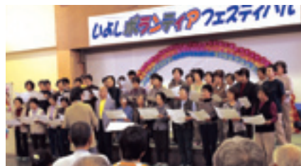
▲第1回 いよしボランティアフェスティバル に出場した『いよしわらべ合唱隊』